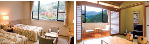
※料理画像はイメージです 当日の仕入れ状況により内容が異なる場合があります