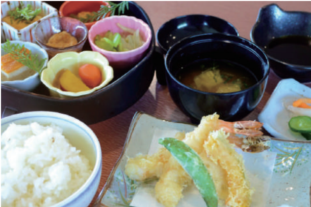
※料理画像はイメージです 当日の仕入れ状況により内容が異なる場合があります